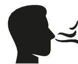
Reuk- en/of smaak verlies

Heb je op dit moment een huisgenoot met koorts en/of benaauwdheidsklachten?