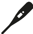
Verhoging of koorts